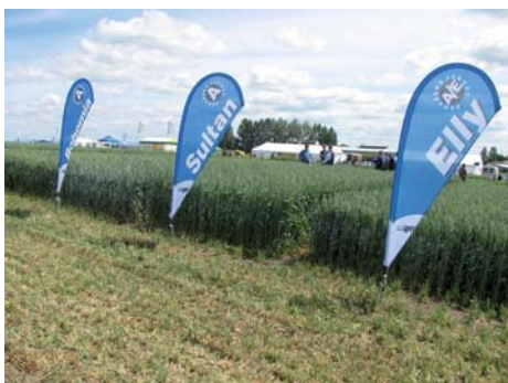
Odrůdy firmy Selgen a. s. jsou každoročně umístěny na výstavě „Naše pole“ v Nabochanech

Odrůda Sultan prokázala v registračních zkouškách a SDO v letech 2005–2008 nadprůměrné