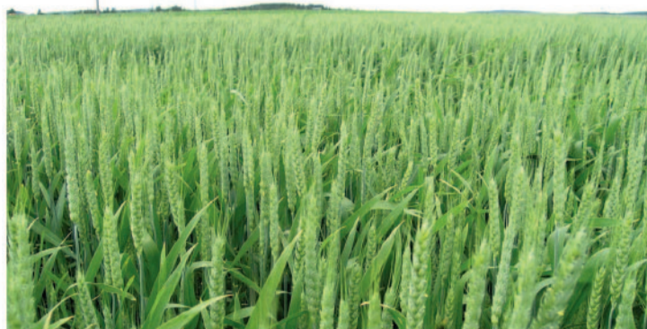
Nová odrůda jarní pšenice Astrid registrovaná ÚKZÚZ od roku 2012

Významnou novinkou letošního roku, o které se budou moci návštěvníci veletrhu dozvědět, je pšenice jarní Astrid. Po delší době se tak od příštího roku dostává k českým pěstitelům nová odrůda pekařské kvality „E“, z tuzemského šlechtění. Astrid byla letos registrována na základě úspěšných zkoušek v ÚKZÚZ v letech 2008, 2010 a 2011. Zvláště v posledním roce přesvědčila svým výrazným výnosem, kdy nejenom že překonala konkurenční odrůdy kvality „E“, ale úspěšně se vyrovnala i odrůdám kvality „A“. K její kvalitativní charakteristice patří zejména velmi vysoký objem pečiva, obsah dusíkatých látek v sušíně vysoký až velmi vysoký, hod-