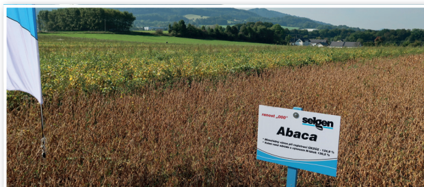
Sója Abaca překvapila na poloprovazních pokusech ve Staříči 2023 svou rychlostí dozrávání

V současné době probíhá sklizeň osiva sóji pro nadcházející sezonu. Množitelské porosty byly letos ve výborném stavu a slibují nadprůměrné výnosy. Vyčištěné osivo je naskladňováno do vaků a následně projde certifikací ÚKZÚZ. Začátkem března bude provedena inokulace hlízkovými bakteriemi, aby doba od očkování do vysetí byla co nejkratší. V roce 2025